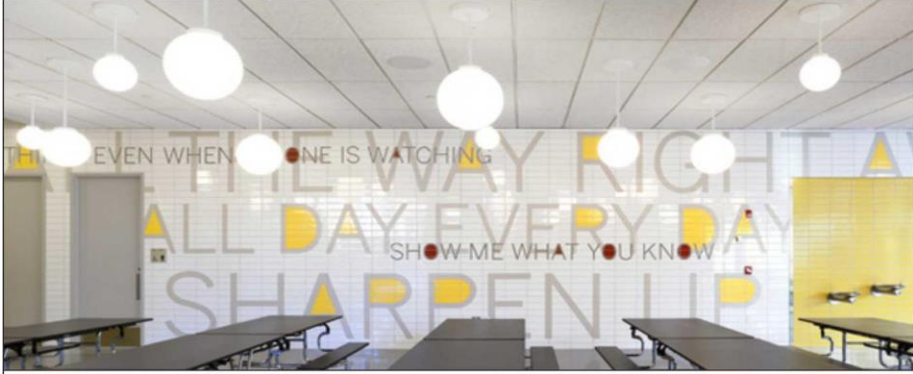
شكل رقم ( ٧ ) نموذج يوضح التصميم بأسلوب التيبوغراف

ج - التسلسل الهرمي : إذا كانت الخطوط بنفس الحجم ، فلن يُفهم ما هو المهم وما هو الأهم ، اذ يفضل توجيه القارئ من خلال العناوين بخط كبير والعناوين الفرعية والتي تكون بحجم خط أقل نسبياً . ينظر : ( Heller , 2011, p 213)