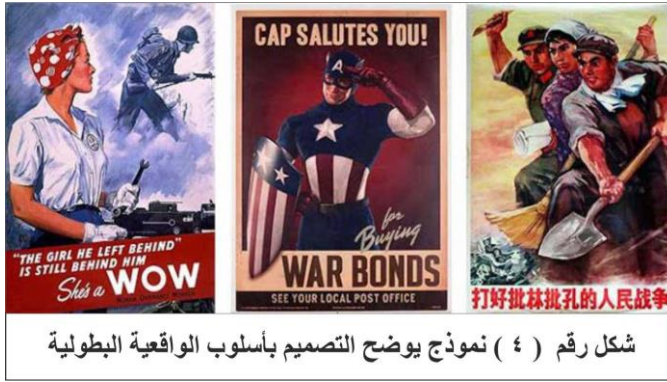
شكل رقم ( ٤ ) نموذج يوضح التصميم بأسلوب الواقعية البطولية

إلى حد كبير، كانت هناك تحركات موازية في روسيا وإنجلترا وأماكن أخرى، شددت على السرعة والتكنولوجيا والشباب والعنف ، وفي هذا الأسلوب استخدمت اشكالاً ورموزاً تعبر السرعة والتكنولوجيا والشباب مثل السيارة والطائرة والمدينة الصناعية . ينظر: ( Heller , 2011 , p 90 )