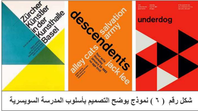
شكل رقم ( ٦ ) نموذج يوضح التصميم بأسلوب المدرسة السويسرية

بعد 1950 ظهر التصميم الأمريكي الهابط الذي اتخذ أنماط مستقبلية أكثر مع منحنيات دراماتيكية وأشكال عصر الفضاء ، ويتميز هذا الأسلوب أيضا بخطه النصي، والأشكال غير الرسمية ، والرسوم التوضيحية مثل الرسوم المتحركة ، وكذلك تميز بالجرأة اللونية من خلال استخدام ألوان مشعة وبراقة نابضة بالحياة . ينظر: ( Eskilson , 2012 , p 101 )