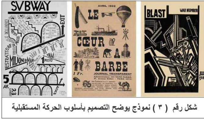
شكل رقم ( ٣ ) نموذج يوضح التصميم بأسلوب الحركة المستقبلية