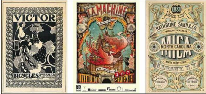
شكل رقم ( ١ ) نموذج يوضح التصميم بالأسلوب الفكتوري

كانت مرحلة العصر الفيكتوري لبريطانيا مرحلة حكم الملكة فيكتوريا التي استمرت من عام 1837 إلى عام 1901 وكانت وقت المعتقدات الأخلاقية والدينية القوية ، أحب الفيكتوريون الأشياء المعقدة والمزخرفة، وانتشر هذا التأثير على جميع مجالات التصميم بما في ذلك الهندسة المعمارية