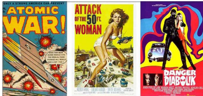
شكل رقم ( ٥ ) نموذج يوضح التصميم بأسلوب الفن الأمريكي الهابط

المثالية وعادة ما تضم تخطيط او صورة لشخصية رئيسة واحدة ذات طابع واقعي ، استخدمت التصورات الواقعية البطولية لنشر الثورة في الاتحاد السوفيتي خلال زمن لينين