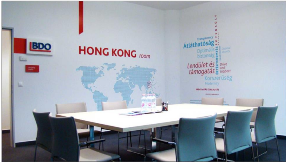
انموذج رقم ( 1 ) يوضح التصميم الجرافيكي لفضاء غرفة الاجتماعات في الشركة السياحية BDO

تصميم منفذ من قبل شركة JOI-Design لصالح شركة سياحة ( BDO ) في ولاية بوسطن – الولايات المتحدة الامريكية ( الابعاد 5 م × 3 م ) ، طريقة التنفيذ ( الطباعة والتخريم واللواصق ومواد اخرى )