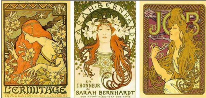
شكل رقم ( ٢ ) نموذج يوضح التصميم بأسلوب الفن الحديث

الفن الحديث هو نمط من الفن الزخرفي والهندسة المعمارية ويعد تصميماً بارزاً في أوروبا الغربية والولايات المتحدة الأمريكية من حوالي 1890م حتى حوالي 1920م