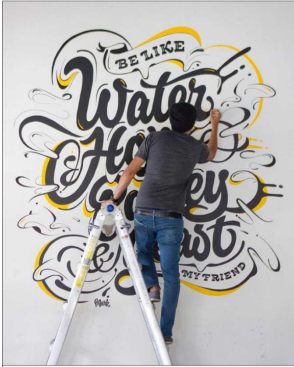
شكل رقم ( ٨ ) نموذج يوضح تقنيات الإخراج اليدوي

لا تتعدى التقنيات الاخراجية للمنجزات التصميمية للجرافيك في الفضاء الداخلي ما هو مستخدم عادة للمنجزات الاخرى من ناحية التقنيات الاخراجية والبرمجيات الحاسوبية ، وكذلك لا تختلف في نوع أجهزة الطبع ، ولكن الاختلاف الوحيد يكون في الخامات المستخدمة الا وهي اللواصق الجدارية ، اذ تكون تلك اللواصق معالجة بطرائق علمية كي تتحمل الظروف البيئية داخل الفضاء الداخلي من حيث الرطوبة والاضاءة والخدش وغيرها ، ومن هذه التقنيات الاخراجية :