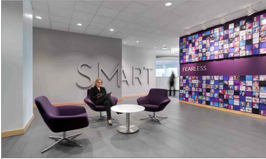
انموذج رقم ( ٢ ) يوضح التصميم الكرافيكي لفضاء غرفة الانتظار في الشركة