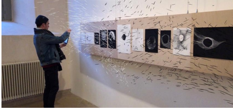
الشكل رقم (٧)

وعرض فيه أعمال الفنانين: كلير بارداين وأدريان موندوت – سلسلة صمت الحجارة، تناول المعرض عدة أعمال بصرية رقمية، تمنح الشعور بالتكنولوجيا والتفاعل مع الجمهور وعرضها بتقنية الواقع المعزز شكل (٧).