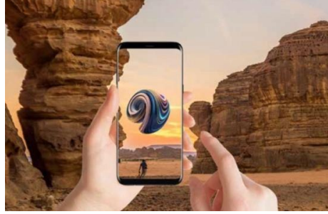
الشكل رقم (٢)

دشنت وزارة الثقافة بالتعاون مع هيئة الفنون البصرية معرض "شبه طبيعي" الذي تناول عددًا من الأعمال الفنية البصرية القائمة على الواقع المعزز، وذلك في أهم ثلاثة مواقع في المملكة العربية السعودية، تقدم الأعمال رؤية تخيلية جديدة تصوّر مستقبل الطبيعة (شكل ٢).