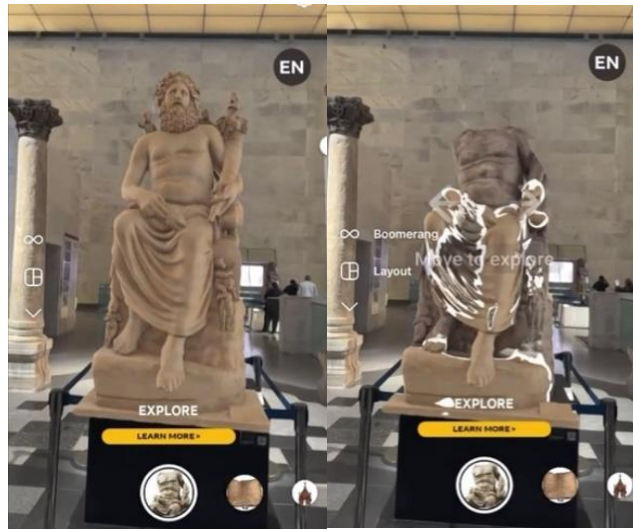
الشكل رقم (٣، ٤)

استخدم المسؤولون في المتحف المصري الكبير عدة أدوات تكنولوجية منها الذكاء الاصطناعي وتقنية الواقع المعزز، للترويج عن معروضاته الأثرية ومحتوياته، ومشاهدة القطع الأثرية غير المكتملة باستخدام الواقع المعزز عبر تطبيق انستغرام (شكل ٣، ٤).